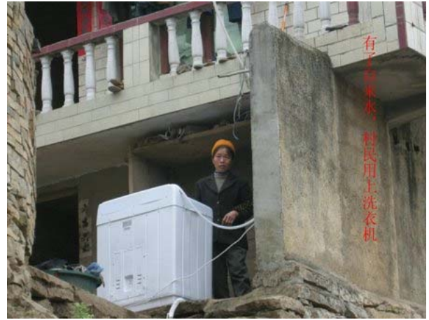
有了自來水，村民用上洗衣機，生活改善了