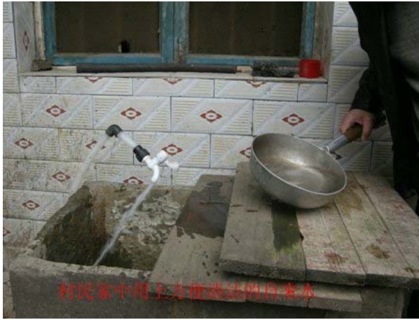
清潔的飲用水，直接進入家中