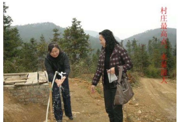
村的最高位也有源源不絕的清水供應