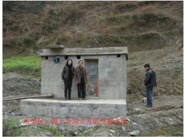
30 立方的低位蓄水池，上建有泵房