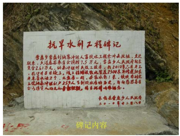
工程完工後的碑記