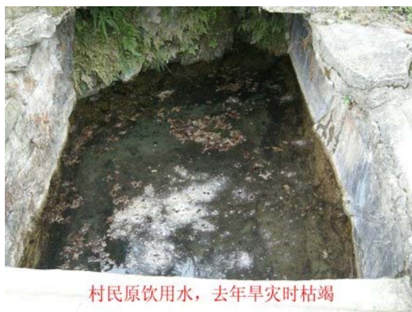
村民原飲用水，去年旱災時枯竭