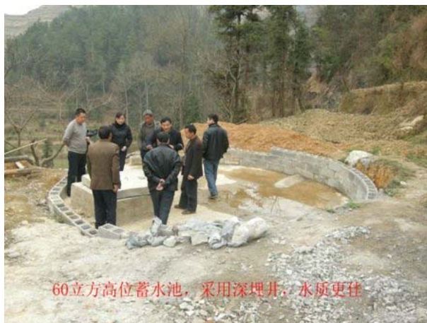
60立方高位蓄水池，採用深埋井，水質更佳