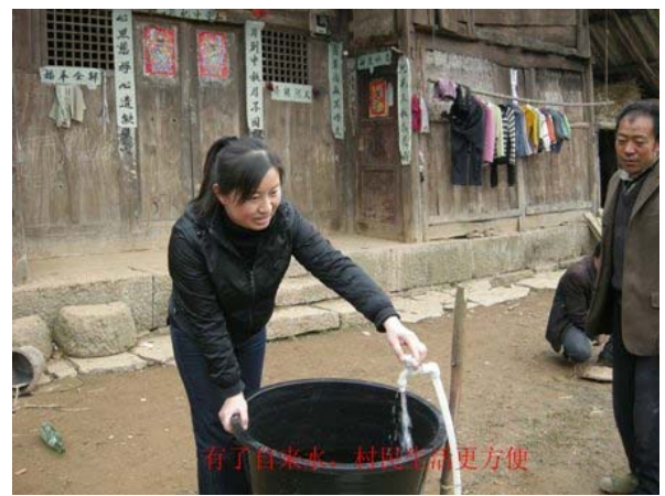
村民開心地安在家中享用清徹的自來水