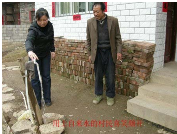
清水源源不絕流向村中每一個家庭