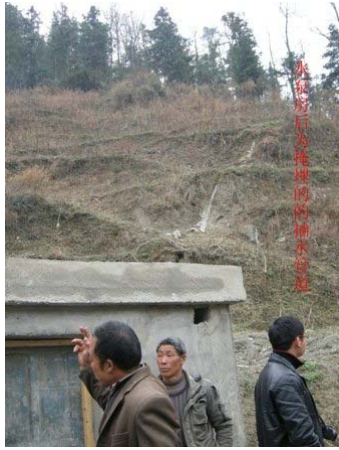
清水經埋藏的水管，流到山下的低位蓄水池