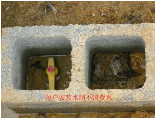
每户安装水闸，避免浪费用水