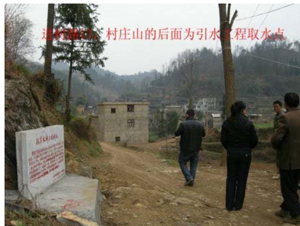
這村後山，村庄山的后面為引水工程取水點