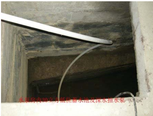
水泵再將水泵到村中每戶