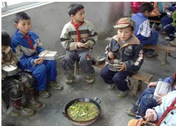
學生在新食堂內吃午飯。