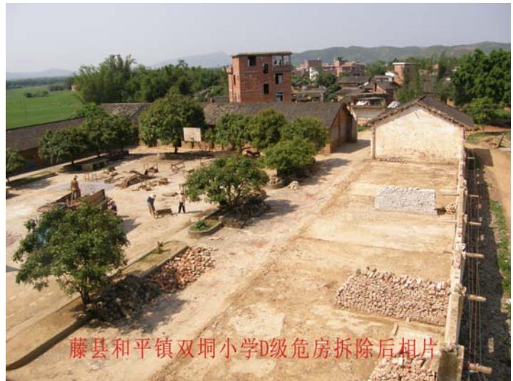
藤县和平镇双垌小学D级危房拆除后相片