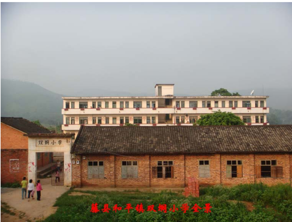
藤县和平镇双垌小学全景