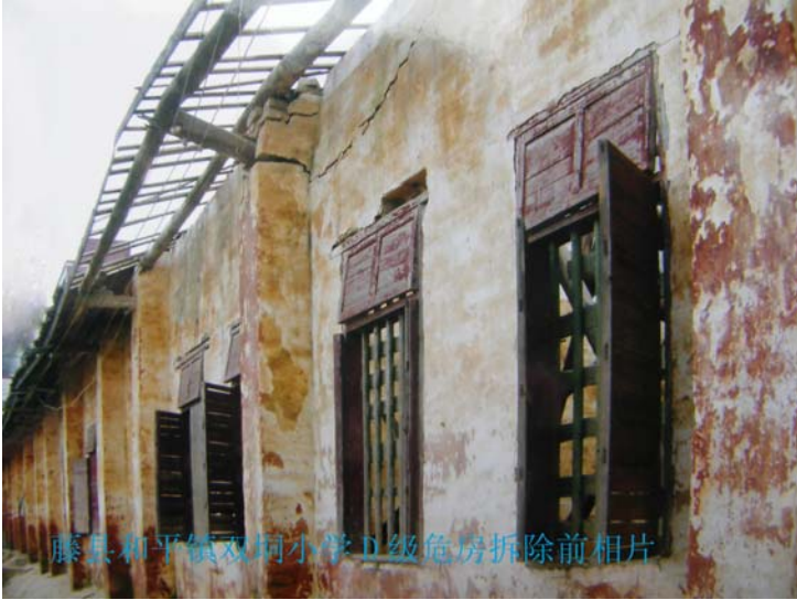
藤县和平镇双垌小学D级危房拆除前相片