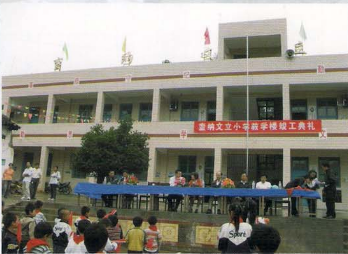
惠水县抵季乡蛮纳文立小学新教学楼竣工典礼