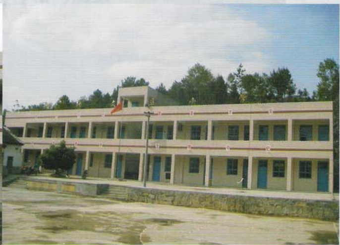
惠水县抵季乡蛮纳文立小学老教学楼