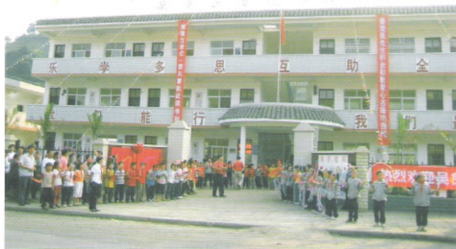
荔波县洞塘乡小学新教学楼