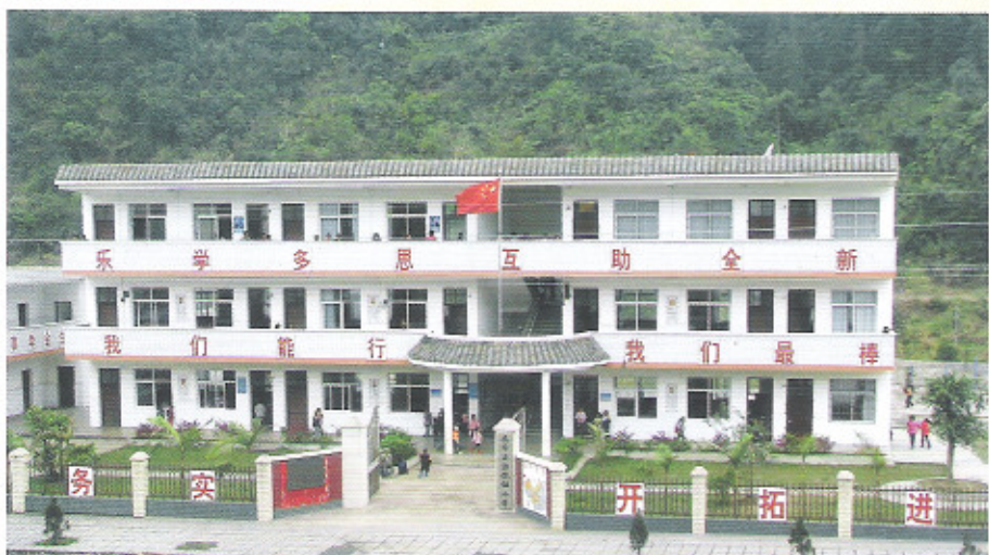
荔波县洞塘乡小学新教学楼全貌

洞塘小学始建于1931年，地处荔波县洞塘乡镇懂朋村，1992年建一栋教学楼，学校开设学前班及一至六年级，现在校生192人（其中：男生99人、女生93人）。老教学楼因年代久远，多处出现裂缝，楼板出现渗水。2009年通过省侨联的牵线、宁波市侨办的搭桥，得到香港港勇基金会捐赠16万元和县市政府、教育局配套33万元，共计49万元，兴建洞塘小学教学楼，建筑总面积为454M 2 的砖混教学楼，目前项目正在实施，预计到2011年7月竣工。