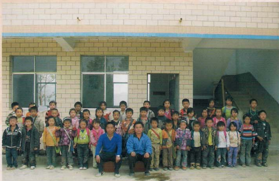
罗甸县纳汝小学师生合影

纳汝小学位于木引乡西北部，距乡政府驻地约15公里，距其他学校约8~9公里。全村辖5个村民组，辐射窖里村3个组，宜龙村1个组。总户数约270户，总人口约1500人，适龄儿童约220人，已入学儿童约210余人左右。原本校开设5个教学班，有公办教师2人，代课教师3人。