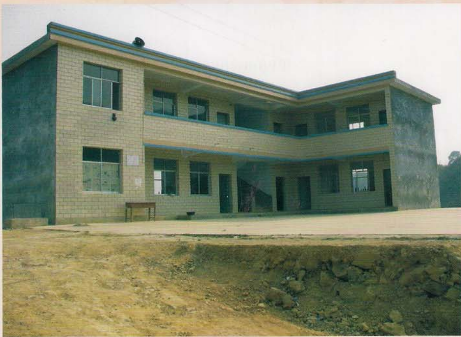
罗甸县纳汝小学新教学楼