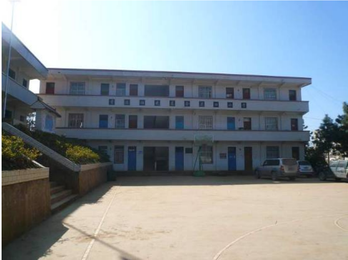
上圖：建校組 2006 年為該校建成的第一座校舍。下圖：義工與校長老師合照。