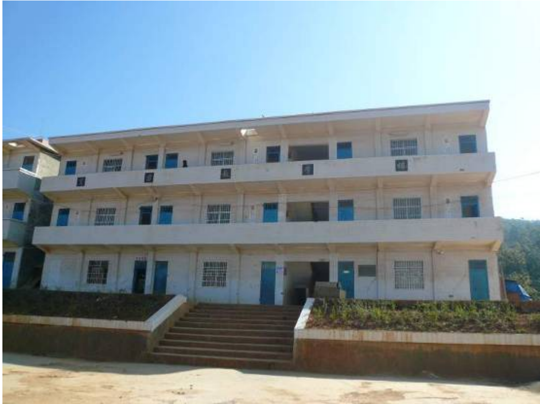
上圖：援建之教學樓，為該校之第二座教學樓，左邊貼近為自建之第三座； 下圖：碑記。