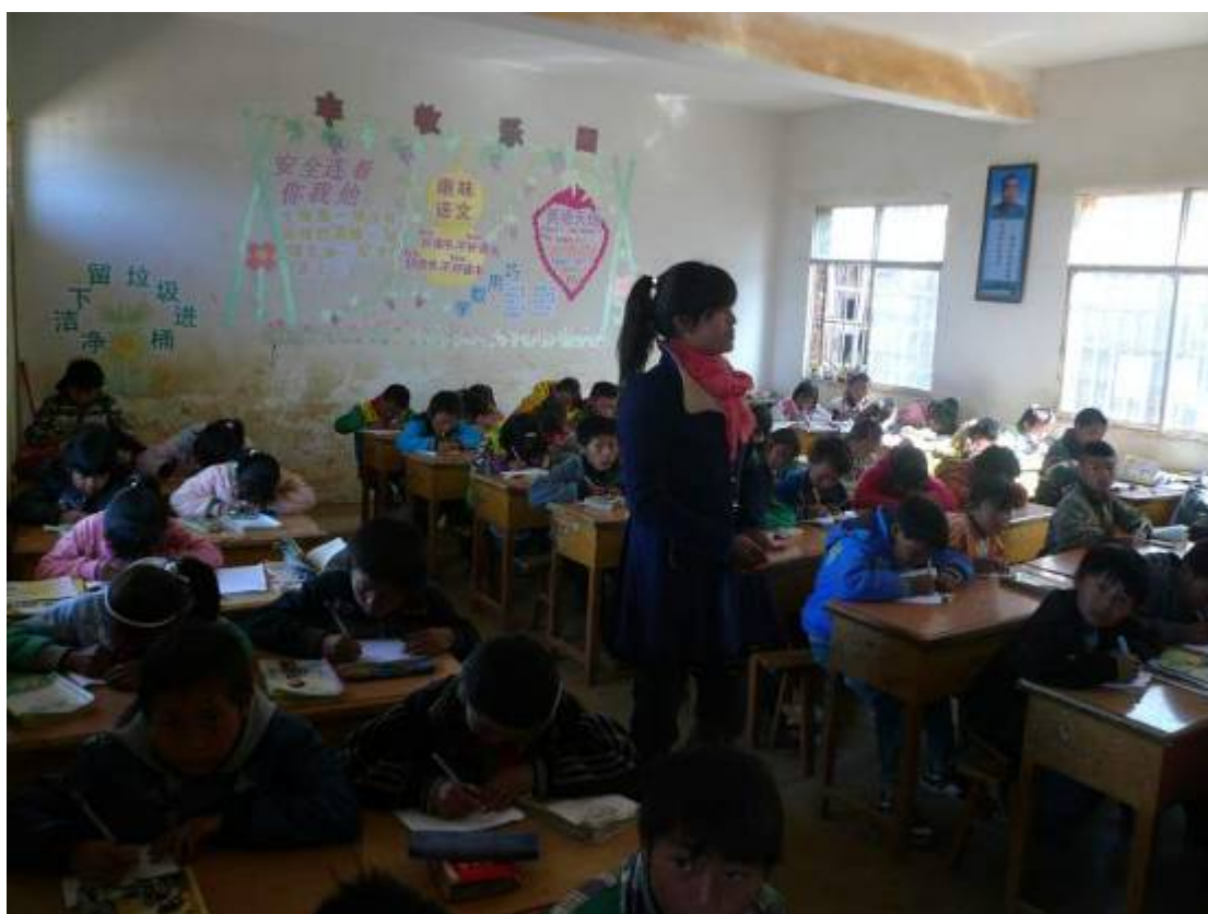
上下圖是其中兩個教室上課情況