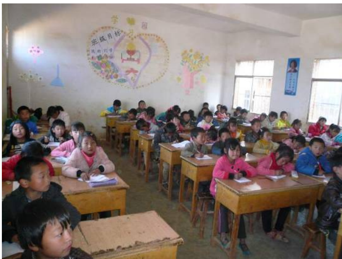
上下圖是另外兩個教室上課情況