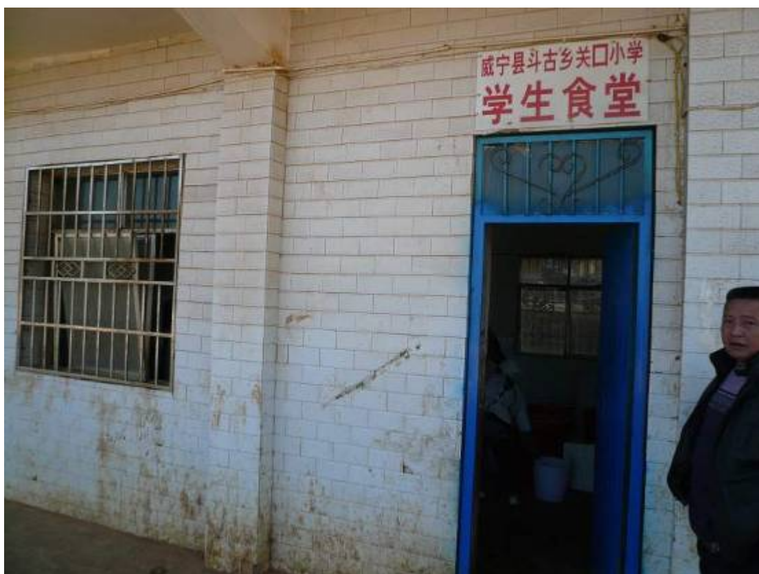
上下圖都是地下改爲食堂的兩個教室，實是廚房。