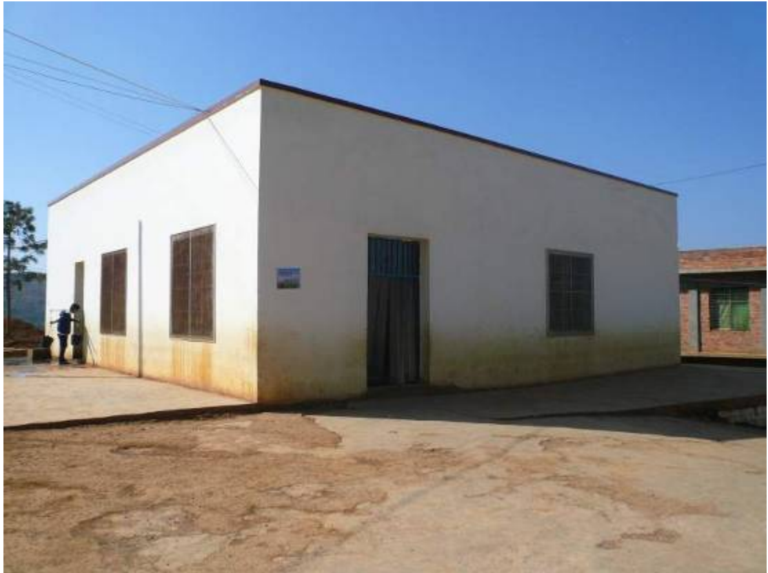
上下圖是另獨立自建的食堂，含餐廳。原因是學生眾多，只有兩個教室的廚房是不敷應用的。