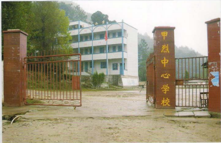
惠水县甲烈乡刘广祥第一小学（甲烈小学）

刘广祥第一小学（中心学校）始建于1932年，地处惠水县甲烈乡红星村十一组，当时为简易的土木结构，2008年得到香港顺德联谊总会刘广祥先生捐赠13万港币和县政府匹配资金27万，修建了一栋综合楼，办学条件大大地改观。