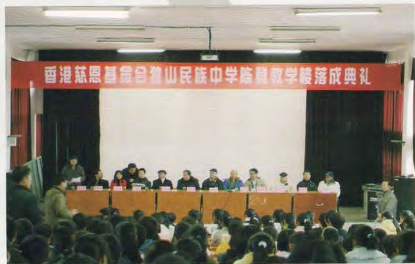
州、县领导和香港慈恩基金会客人一同庆祝陈登新教学楼落成