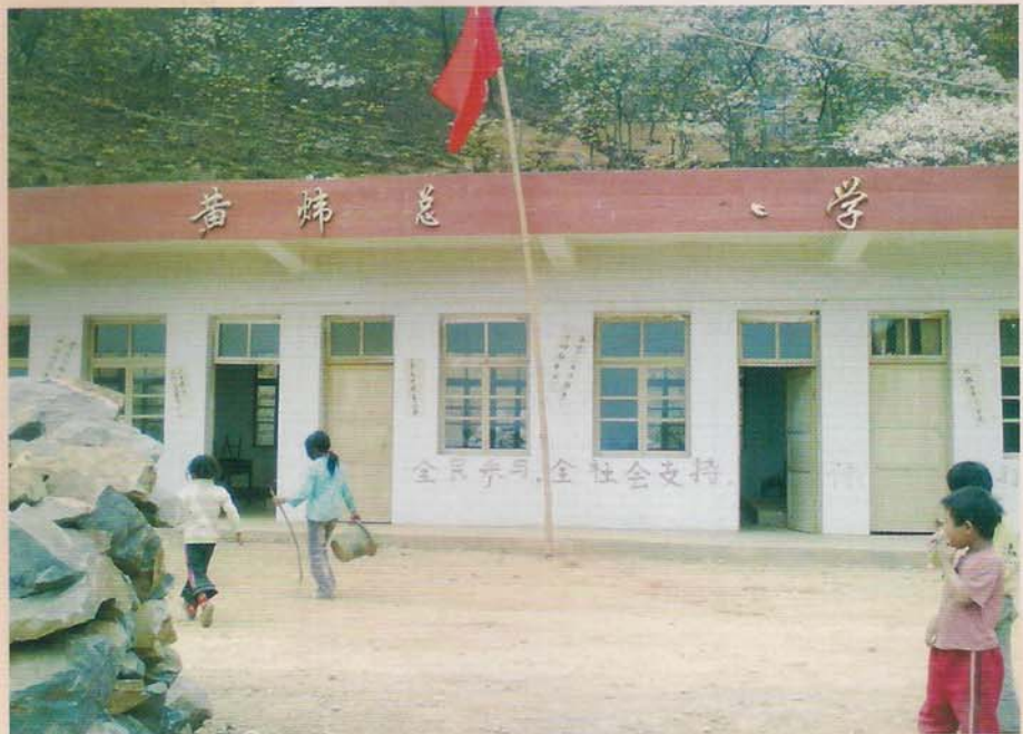
罗甸县班仁乡油落小学新教学楼