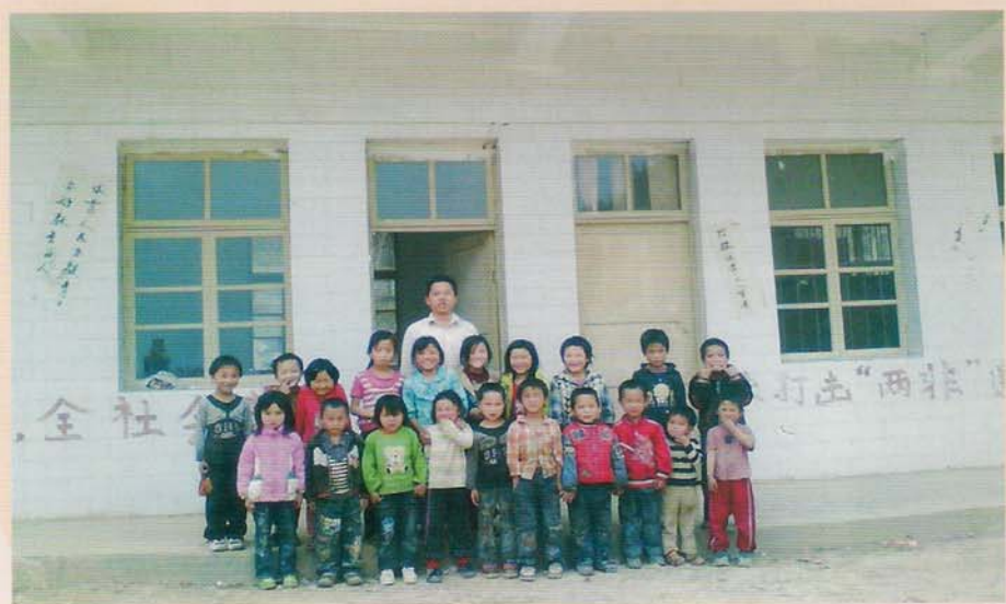
罗甸县班仁乡油落小学师生合影