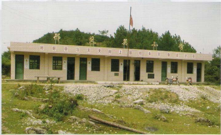
惠水县大坝乡邢凤英小学新教学楼

迁址新建后，学校服务范围扩大，覆盖整个绿化村人口达2100余人。由于改善了办学条件，优化了校园环境，拓宽了学生活动场地，生源比原校址增多了20多人。学校现开设一至三年级共个3班，在校生95人（其中：男生51人、女生44人）。