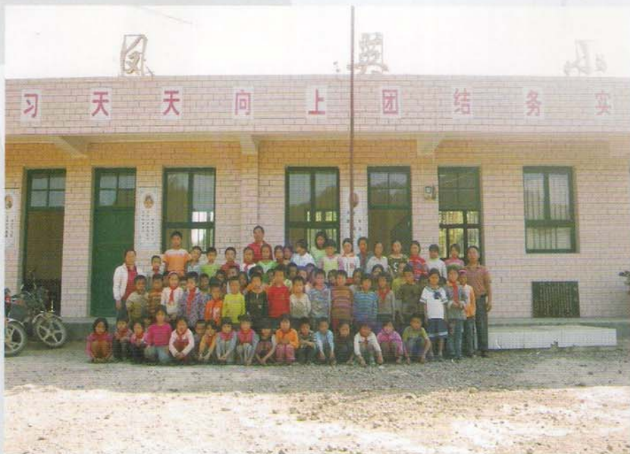
惠水县大坝乡邢凤英小学师生