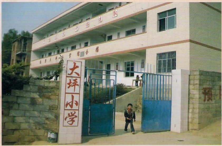
罗甸县板庚乡大坪小学

大坪小学陈登综合楼建成后，大大地改善了学校的办学条件，学校服务范围也更加扩大了，覆盖人口达7500余人。由于改善了办学条件，优化了校园环境，拓宽了学生活动场地，生源也相应增多了40多人。学校现开设一至六年级共11个教学班，在校生478人（其中男生244人、女生234人），学前班60人。