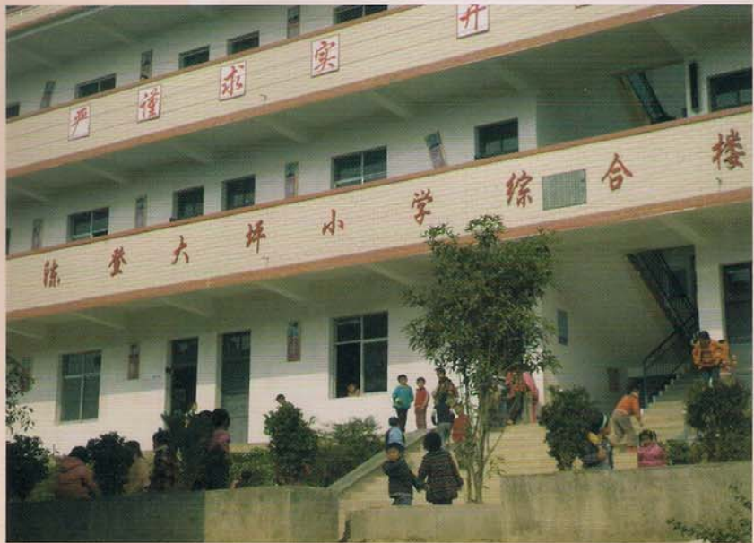
罗甸县板庚乡大坪小学陈登教学楼