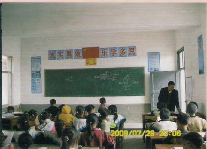
罗甸县板庚乡大坪小学师生在新教室上课