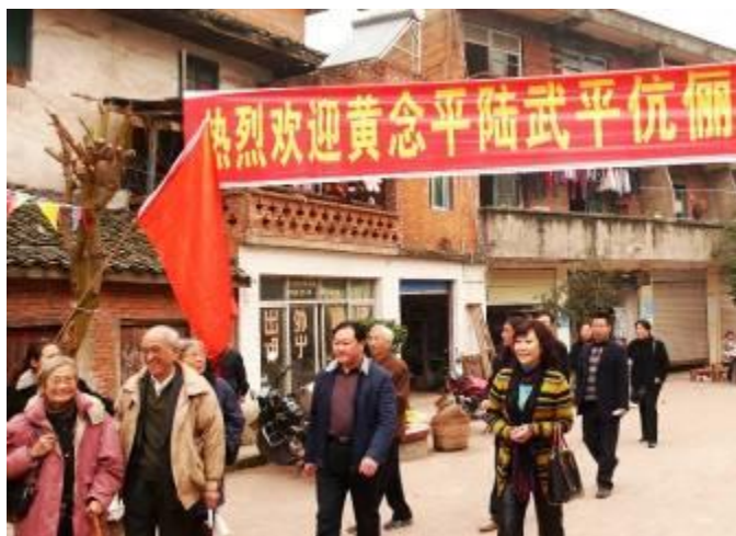
捐方臨近學校便受到熱烈歡迎