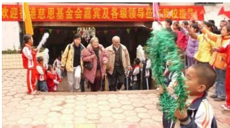
女兒陪捐方伉儷踏進校園便聽到夾道歡呼