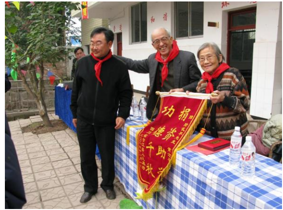
校長向捐方伉儷致送錦旗