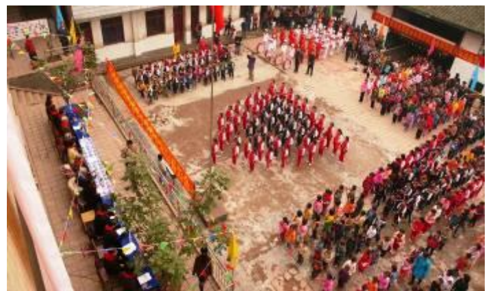
從上而下俯瞰觀禮台及操場全景