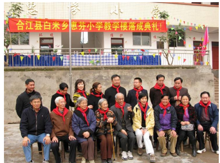
落成禮後捐方六位與教師合照