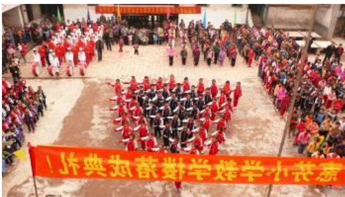
落成禮後從觀禮台看學生表演