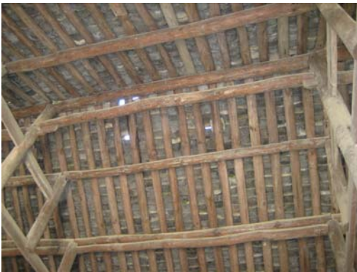
學生便一直在這種環境中上課