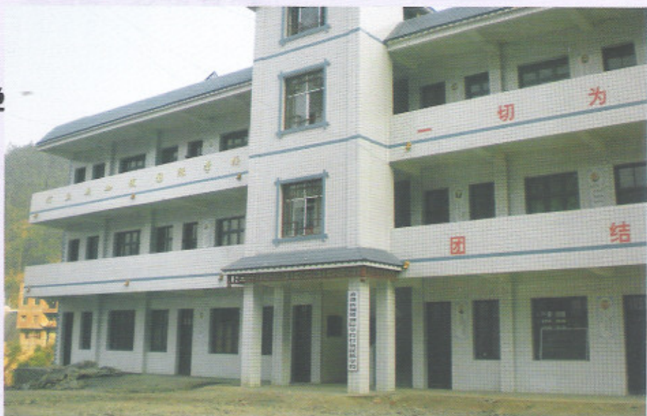
三都县打鱼乡打鱼小学新加坡国际学校教学楼

新校舍建成后，学校服务范围扩大，除原有的10个村人口外，扩增了都江镇的柳叠村和拉揽乡的高寨村，覆盖人口达25000多人。由于改善了办学条件，优化了校园环境，拓宽了学生活动场地，生源增多了150多人。学校现开设一至九年级共20个班，在校生1015人（其中：男生728人、女生287人）。