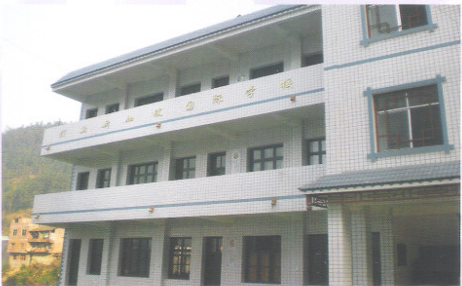
三都县打鱼乡打鱼小学新加坡国际学校