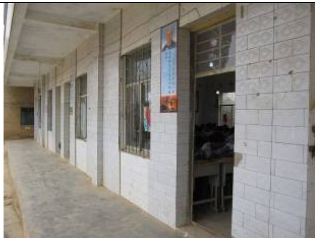
學生在捐建教學樓教室中上課。