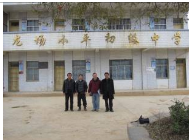
義工與校長在教學樓前合照。