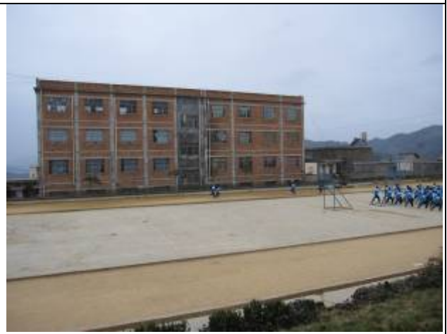
原捐建教學樓背面。