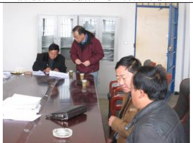
上左為新教學樓。上右為義工在辦公室訪問學校情況。

義工評語： 記得 06 年奠基時學校只有現時改為老師宿舍的一幢 2 層比較好的教學樓，其餘全為危房，副校長亦說當年捐建的 4 層教學樓竣工時為全鄉的地標，如沒有了當年小平教育基金的捐建，今天學校就可能沒有這麼快發展起來了。綜觀此校管理良好，2000 多人的學校雖然部份地方還未平整，但仍然整齊清潔