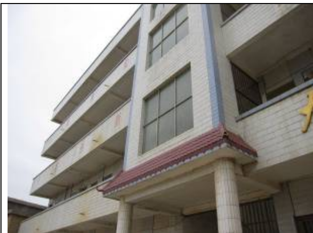
原捐建教學樓另一角度。