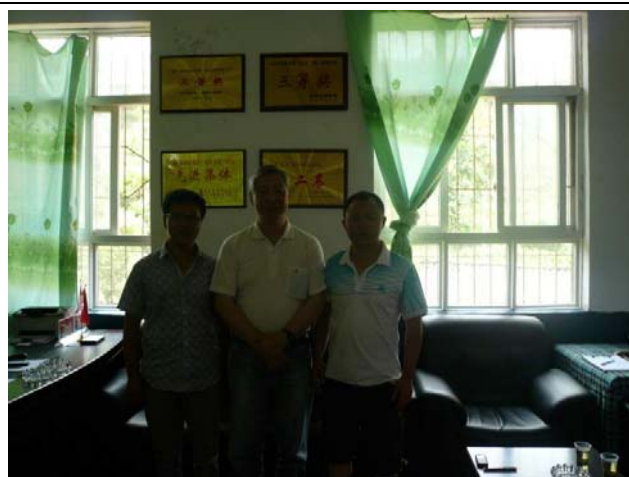
義工與校長及教育局人員在校長室合照