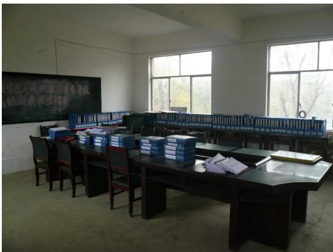
上下圖是另兩個已改為教師辦公室之教室