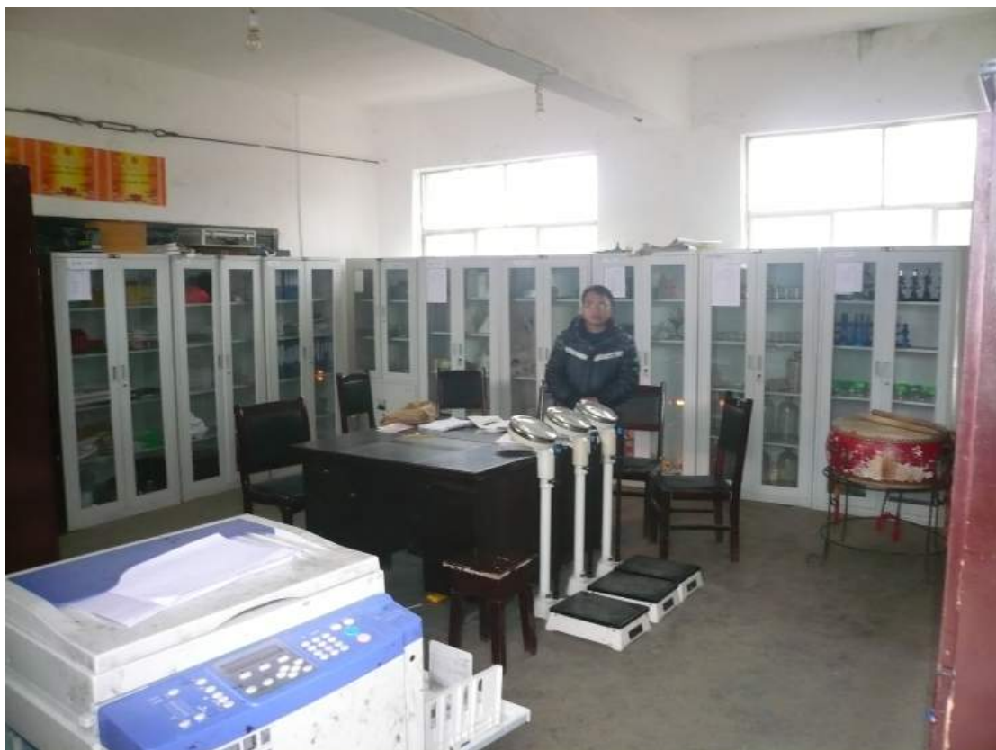
已改作儀器室之教室