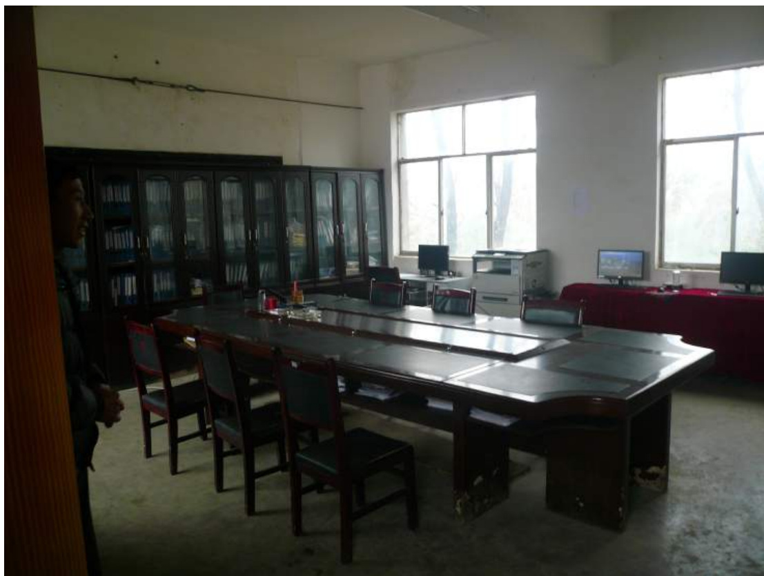
已改為教師辦公室之教室