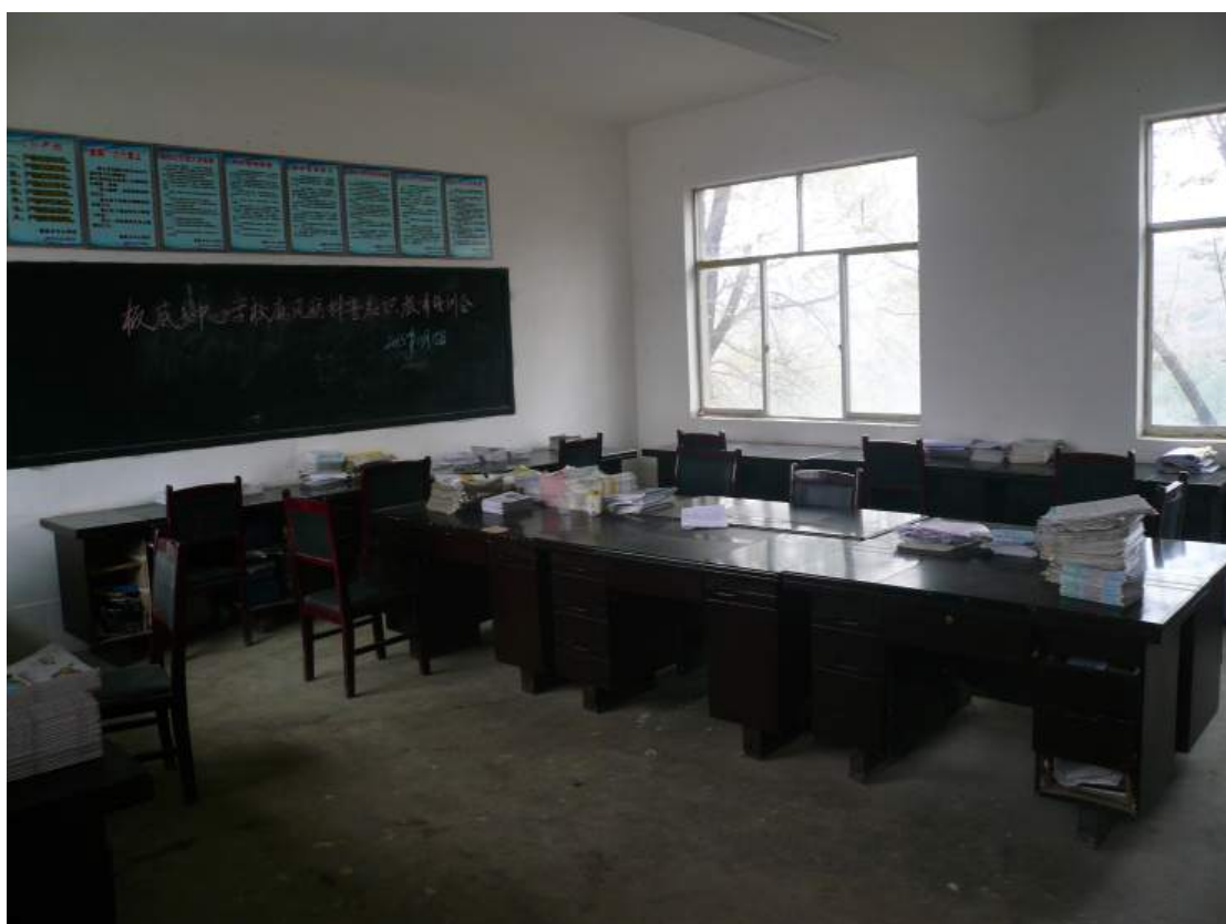
已改爲教師辦公室之教室