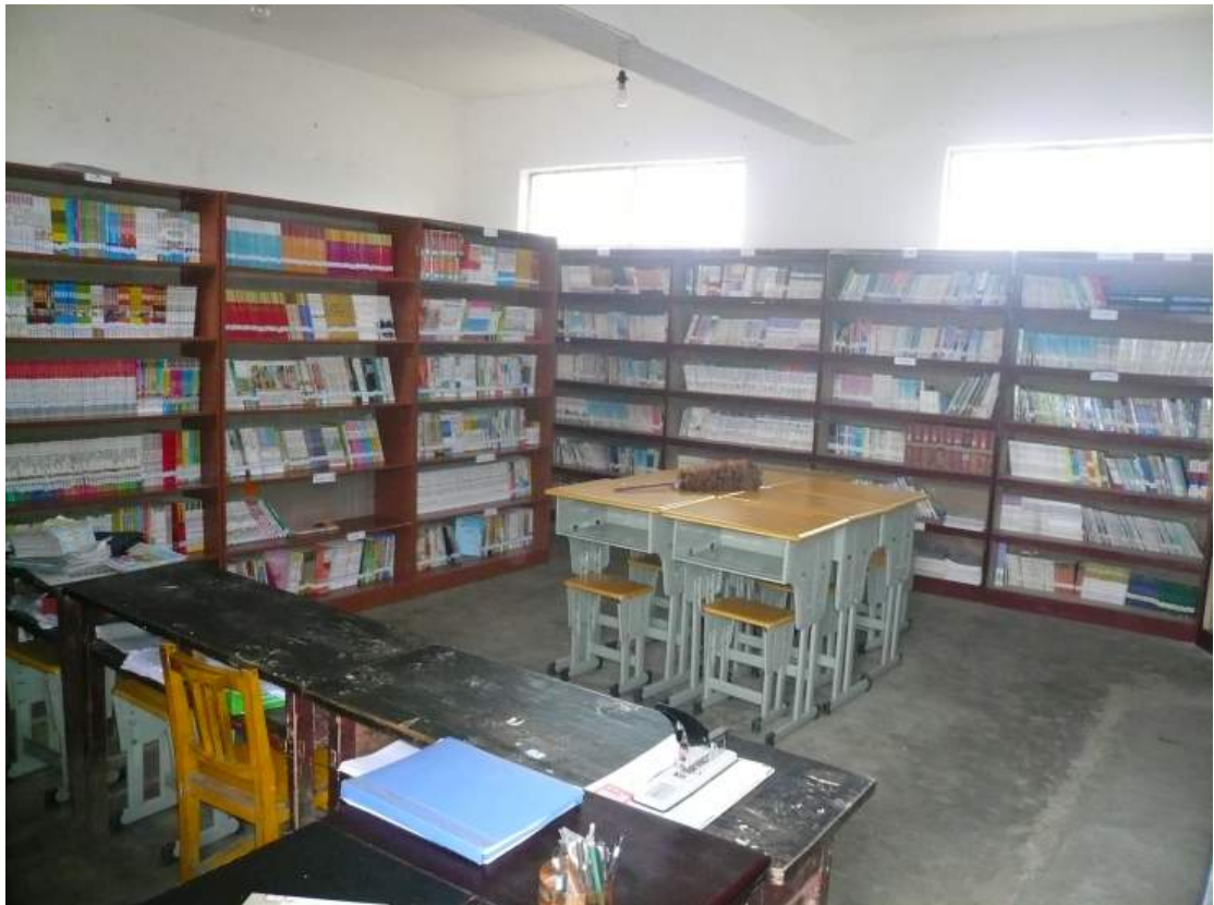
已改作圖書室之教室