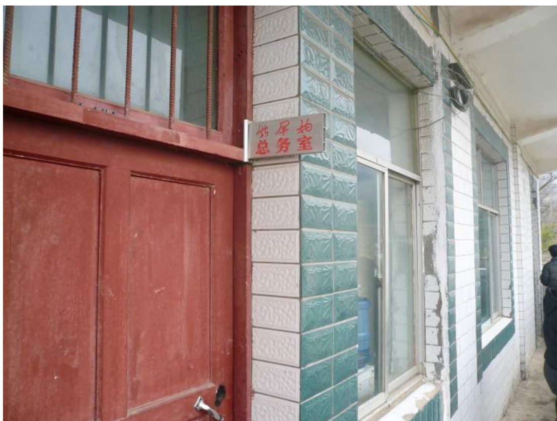
改為其他用途之教室