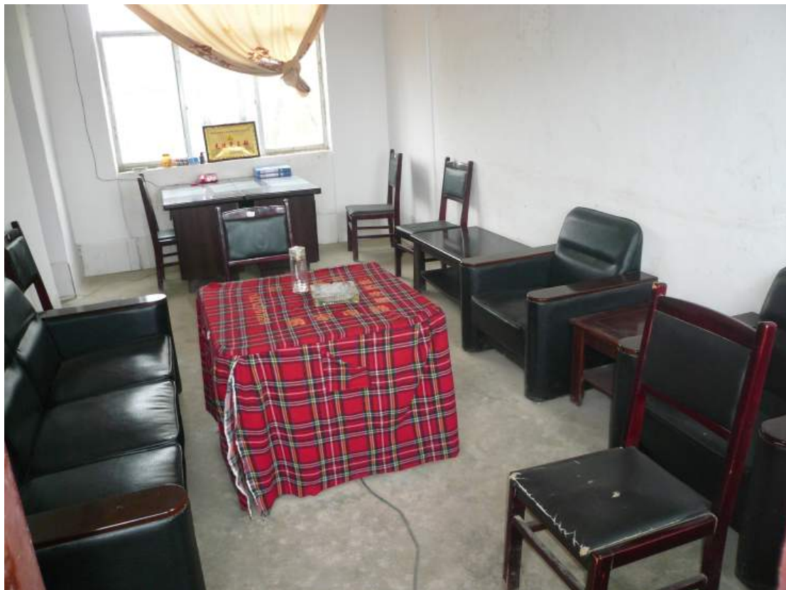
上圖：原有之辦公室