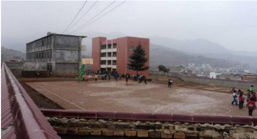
何信和希望小学学校全貌