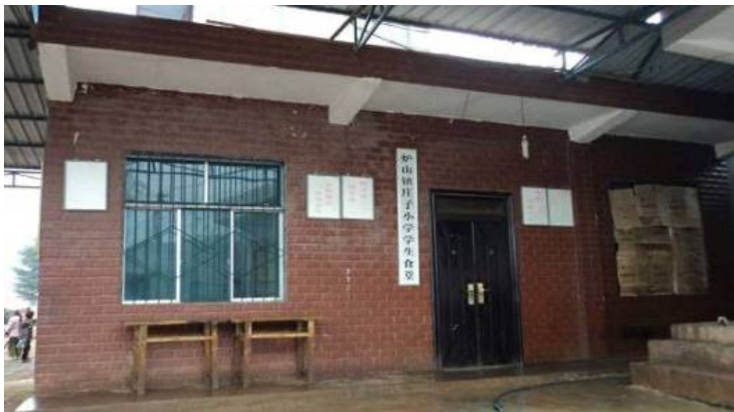
何信和希望小学学生食堂