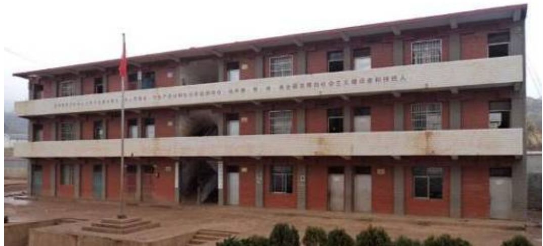
何信和希望小学教学楼