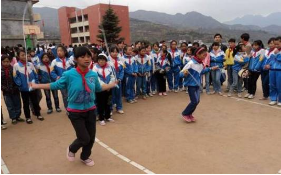
何信和希望小学全体学生活动场面一角