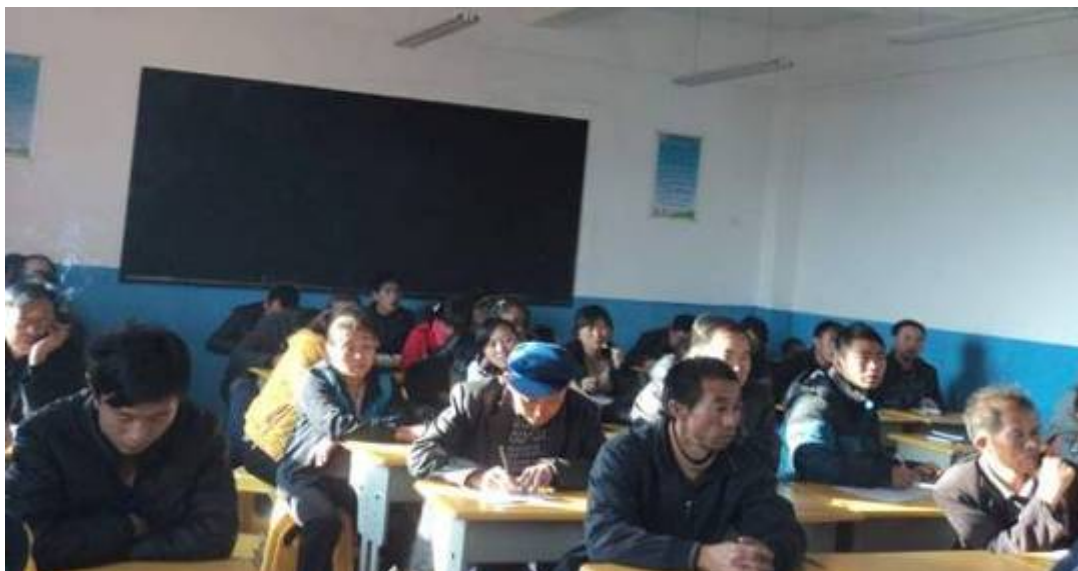
何信和希望小学教师集体工作照片