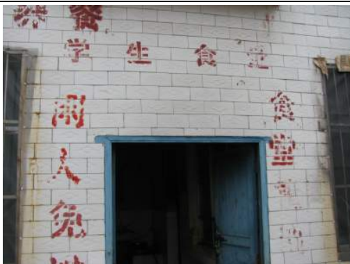
上：學生食堂（實為廚房）