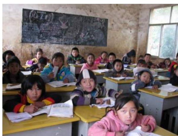
上：其中一個教師內況