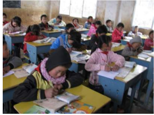
上：另一個教室內況