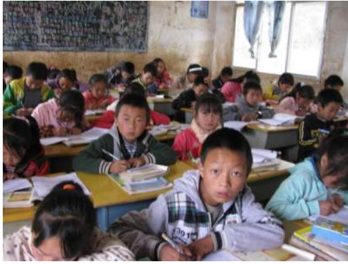
上：另一個教室內況