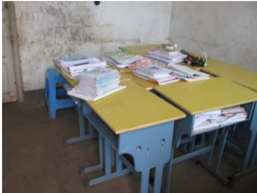
上：其中一個老師辦公室