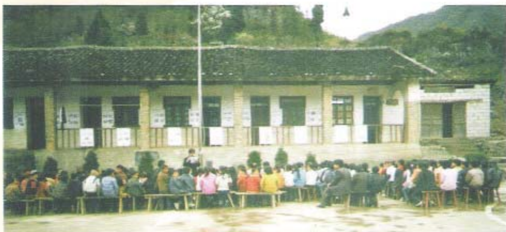
荔波县水尧育苗(拉交)小学原教学楼

迁址新建后,学校服务范围扩大,除原有的上下拉交人口外,扩增拉党组和懂港组,覆盖人口达1900人。由于改善了办学条,优化了校园环境,拓宽了学生活动场地,生源比原来增多了30多人。学校现开设一至六年级共个6班,在校生148人(其中:男生76人、女生72人)。