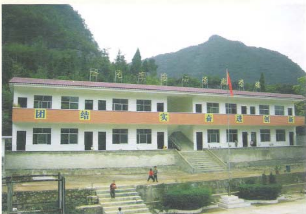
荔波县水尧育苗(拉交)小学新教学楼