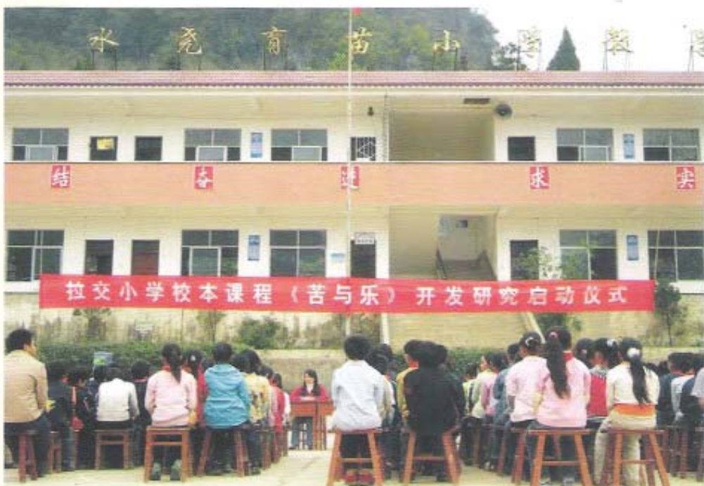
荔波县水尧育苗(拉交)小学师生在新教学楼前