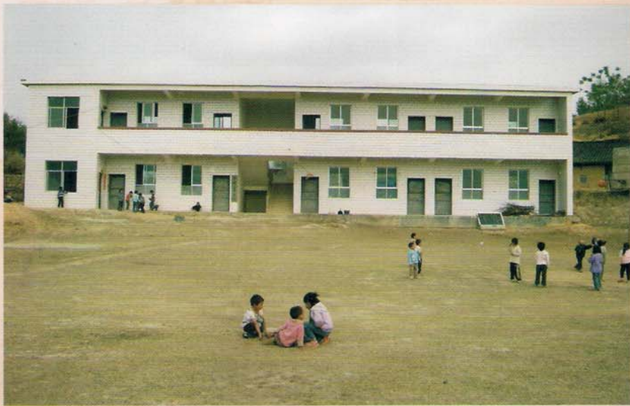
罗甸县罗悃镇干村小学新教学楼

干村小学始建于1970年8月，学校地处罗甸县罗悃镇干村村，是一所民办助的村级小学。校舍为土木瓦结构，开设一至四年级。由于校舍属简易的土木瓦结构，加上年久失修，墙体已往外倾斜，多处檩条腐朽断裂，已危及师生的生命安全。1999年学校不得不停办，学校停办后当地学生只好到距家7公里以外的纳闹小学就读，学生每天步行往返14公里的山路之间，很不方便，因而有不少的学生推迟了入学的年龄（八九岁才读一年级），还有的学生因每天往返路途艰辛而辍学。2005年干村小学得到香港慈恩（小平）教育基金会罗佰行先生捐赠7万元，县政府教育局配套7万元兴建干村小学砖混教学楼，面积380M 2 于2005年9月竣工使用，从而结束了干村小学无校舍的历史。校舍建成后主要服务于大干、小干、巴拉等7个自然村寨，覆盖人口达3500余人，学校的建成使这里孩子又重新得到就近入学，同时也成为当地群众提供农业技术培训的场所，学校的建成为推进当地的基础教育和农村经济的发展都能起到重要作用。然而由于近年村级教师缺编，生源逐年减少，学校布局调整等原因，现只有代课教师2人，学校的办规模仅为初小，在校生共53人。