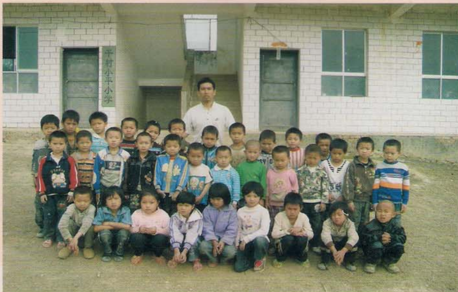
罗甸县罗悃镇干村小学师生合影