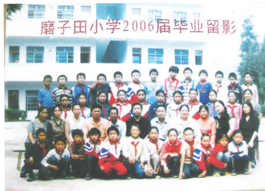
贵定县洛北河乡磨子田小学毕业班师生在新教学楼前合影