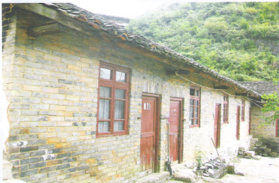
贵定县洛北河乡磨子田小学老教学楼

新建后，学校服务范围扩大为7个自然村，覆盖人口达2190人。由于改善了办学条件，优化了校园环境，拓宽了学生活动场地，生源增多了10多人。学校现开设一至六年级共个7班，在校生202人（其中：男生130人、女生72人）。