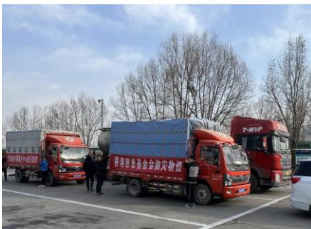
2023年甘肅大地震送上救援物資