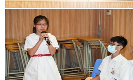
第二屆慈恩學業進步獎頒獎典禮