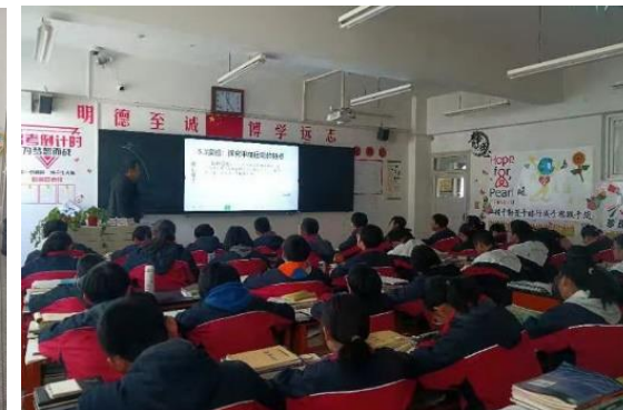
會寧縣第三中學的智能黑板