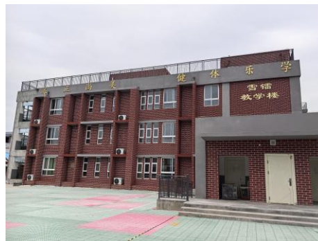
河南省援建的教學樓