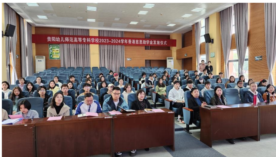
貴陽幼兒師範助學金發放儀式