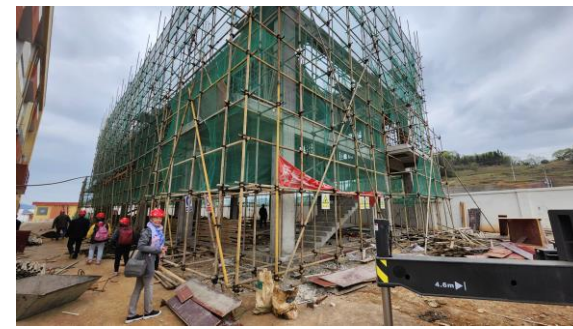
義工們考察貴州安龍縣援建項目