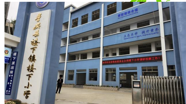
貴州興義市綜合樓竣工