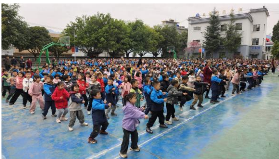
義工們考察貴州省學校情況