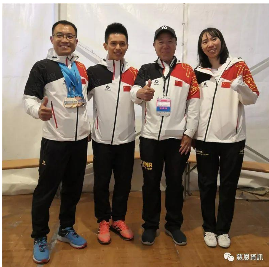
國家體育總局領導和教練們的合影