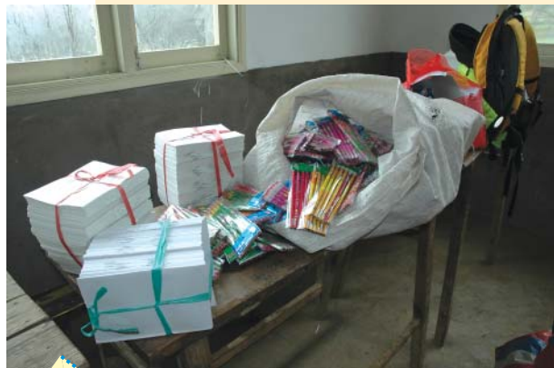
義工帶到貴州準備派給山區兒童的文具物資。

多年以來，扶貧組在組長和各義工毅然承擔下，付出了無數時間，得到了大家有目共睹的成績，並沒有辜負善心捐方的期望。雖然很多熱心捐方，對我們的工作進度，給予肯定和理解，在這裡仍要闡釋一下當中的程序，以增透明度。