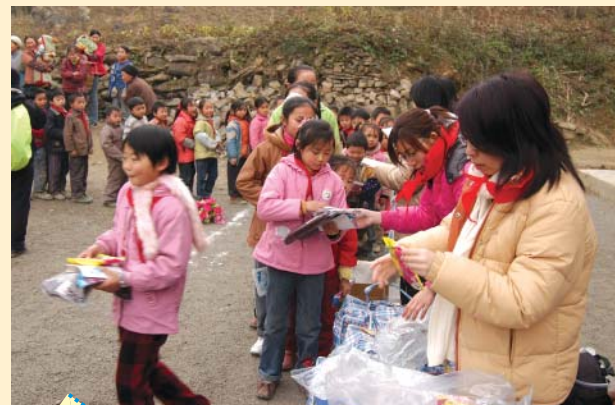
山區兒童排隊領取由本會義工派發的文具禮品，秩序井然。

我們扶貧組從助學組取得受助學童交回的申請表後，會選出其中無父母的孤兒、單親的或父母傷殘有病的……，再通知他們，由受助人寄回詳細資料。經過郵遞往來，到我們收到資料時，才按正確地址寄出包裹(內有各家庭成員的衣物及文具等)並附入回條。大量分配衣物及包裹，實需不少人力、物力、時間，才能完成包裹。再集合一定數量的包裹(約100多包)，才能運入國內寄出。在此期間，我們組長和各義工，會進行評核申請表內容、審閱資料、抄寫、影印、檔案整理、包裝、郵遞，除了付出時間外，「慈恩」也要付出相當的額外雜費支出。