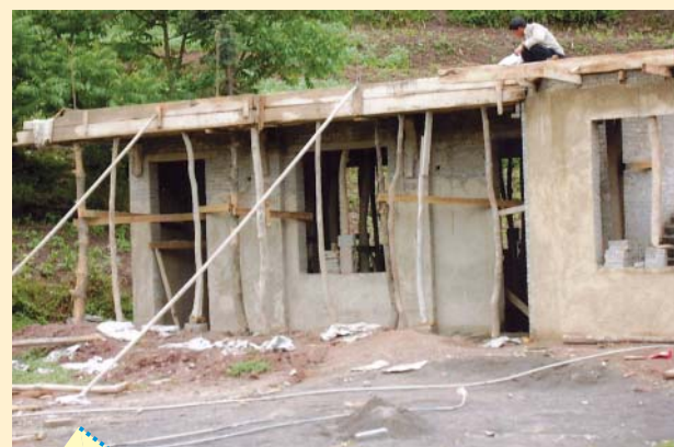
興建中的新校舍，為山區村民帶來了希望。