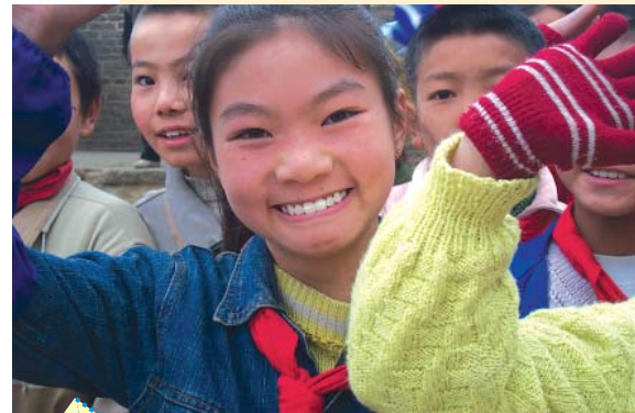
山區教育水平提高，孩子們直接受惠。

他們的工資更令人慨嘆，最低的每月只有¥30，還時常無糧出。教師要下田耕種以養活自己。