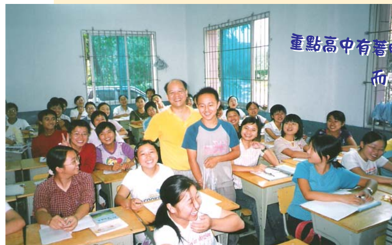
重點高中有著明亮 而整潔的課室

「鮮花曾告訴我你怎樣走過,大地知道你心中的每一個角落……」別離的歌聲在課室盪漾。每次跟學生交流後,他們都唱著同一首歌。在同一課室內,同一班學生身上,他們卻有著不相同的命運。在千多份交流信件中,有著一個又一個感人的故事。