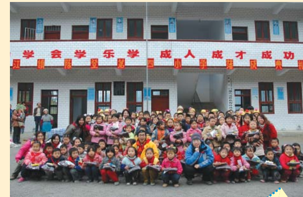
新校終於落成了，來一張大合照留作紀念。