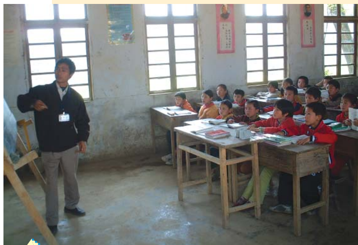
貧困老師得到扶助，可以更安心於教學工作了。