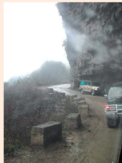
貴州山區道路狹窄迂迴，顛簸險峻，汽車行走須非常小心。

因為每次去的都是不同的村子，那村中的孩子和鄉親都可能是第一次和外地人接近，第一次有「能夠蓋座新校」的希望。對他們來說，可能是幾代人的願望能夠實現的機會。能夠做一個中介人，把香港人為國家同胞貢獻的那份心意帶到山區去；能夠看到每間學校的落成，使得百多個孩子（以及以後每年新入學的二、三十個孩子）能夠離開千瘡百孔的危校，或者能夠就近入學，或者不必再隔日才能回校學習，我們的心情，怎會不激動，怎會不感到喜悅和自豪？