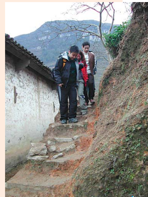
通往危校的山徑，凹凸不平，義工們一步一驚心。

我們也能夠從孩子身上、從鄉親身上，學習和感染到他們樂天、純樸的天性，他們沒有機心的分享（那怕是一個煮熟的馬鈴薯），衷心的謝意（送別時靦腆的笑意和眼神），都使我們從城市去的所謂文明人感到慚愧：我們是不是太慣於把感情掩飾了？甚或：我們是不是有自以為是的優越感？誰的生活更富裕，我們的物質或是他們的山野田園？我們永遠不能填滿的欲望或是他們的純樸？