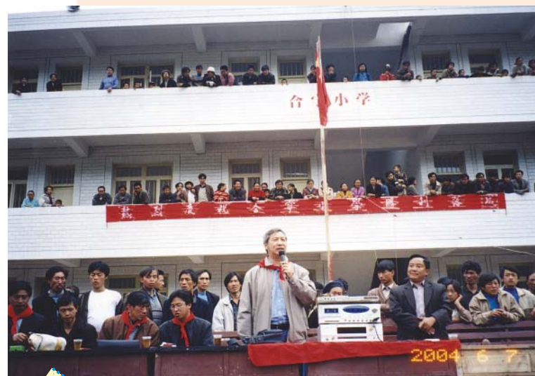
看到眼前的新校舍，感到極大的滿足和自豪。

很多人都認為前去那些偏遠的山區考察和建校是非常艱苦的，吃不好、住不好，整天在顛簸中，與那些不注重衛生的人親近，是很難忍受的。更有甚者，以為義工只有付出，那有收穫？每次聽到這些話語，我總是帶著笑容地回應說：我的得著遠遠超過付出的！我們一般是住在縣城，環境比初去貴州的時候好多了！房間有衛生間，空調（我是不需要的，即使在夏天，不