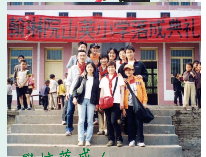
學校落成，義工高興！